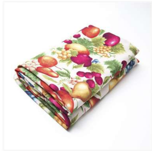
CUEBIERTA DE ALACENA